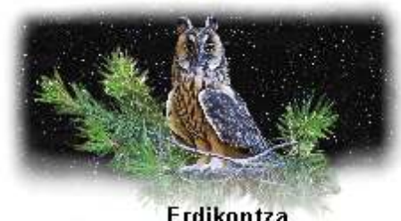
Erdikontza Búho Chico ( Asio otus )

When you go to Guirguillano, you will see the paradise When you come to Guirguillano, you will see the paradise